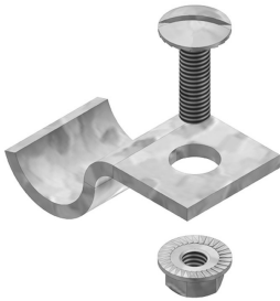
Befestigungsbügel SLOS HDKLIE HDBKID25