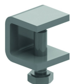
Deckelklemme für KLL KLLDK

geeignet für horizontale und vertikale Strecken.