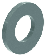
Unterlegscheibe (DIN 125-1 A) RO