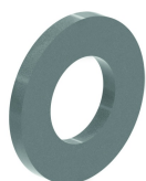
Rondelle (DIN 125-1 A) I6RO