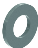
Rondelle (DIN 125-1 A) I6RO