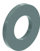
Rondelle (DIN 125-1 A) I6RO