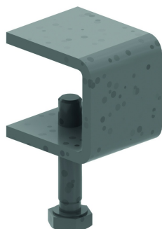
Attache couvercle ZMDKIG