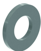
Rondelle (DIN 125-1 A) RO