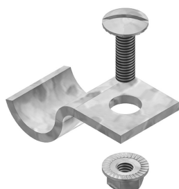
Etrier de fixation pour HDKLIE HDBKID25