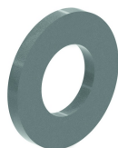
Rondelle (DIN 125-1 A) RO