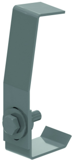
Dekselklem voor HDKLIE DKI