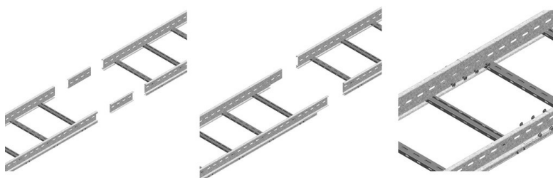
Zelfborgende moer en bout VM