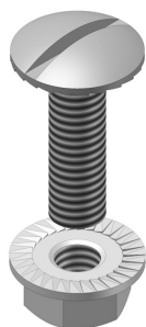
Zelfborgende moer en bout VM